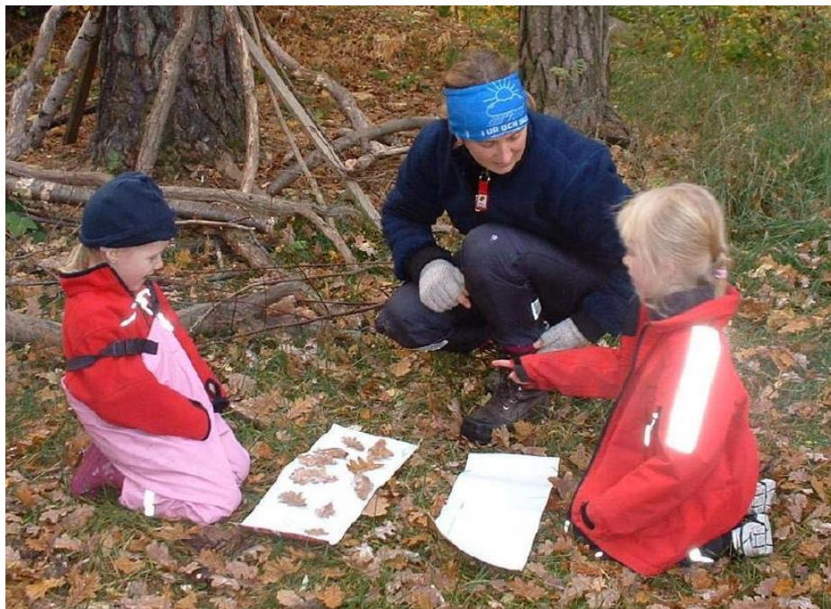
Ilustración 16: El equipo facilita el aprendizaje infantil