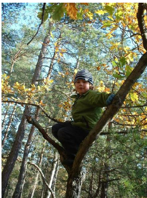
Ilustración 5: Escalar árboles es una actividad popular en todas las escuelas I UR OCH SKUR

La pedagogía está basada en la convicción de los fundadores de que “los niños reciben ayuda en su desarrollo de las cosas halladas en la naturaleza. Aprenden a reptar, saltar, equilibrarse y escalar sobre árboles caídos y rocas musgosas. Es un patio de juego ideal. Los niños adquieren el sentimiento de grupo mientras escuchan cuentos de hadas bajo un árbol compartiendo un picnic. Sus sentidos se entrenan saboreando, oliendo, tocando, mirando, escuchando y comparando cualquier cosa que pueda encontrarse en una pradera, un bosque o un lago. La curiosidad y una mente inquisitiva se estimulan rápidamente cuando los niños están al aire libre. Cada oruga, escarabajo o flor pueden provocar un aluvión de preguntas y pensamientos. Todo esto ayuda a los niños en I UR OCH SKUR a alcanzar a construir una atracción por la naturaleza que durará toda la vida”.