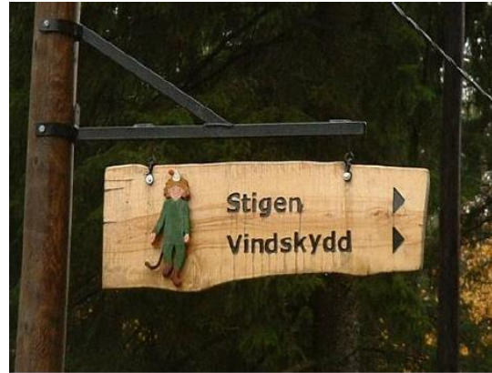
Ilustración 3: Señal indicativa del sendero de Mulle

Gösta Frohm vivió en Lida, un área recreativa al aire libre, justo al sur de Stockholm. En este lugar hay divertidos caminos naturales de acuerdo a cada personaje, con bonitas señales visuales. Las actividades son simples, basadas en la historia introductoria de cada personaje y enfocadas a los niños. Padres y monitores pueden adquirir un folleto de guía para los senderos. El sendero de Nova finaliza en la cumbre de una pequeña colina junto a una ahora abandonada cabaña. Hay un alojamiento para un cohete accesible con silla de ruedas y una bonita vista.