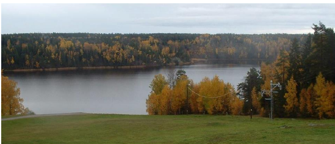
Ilustración 2: Área recreativa al aire libre de Lida

Mulle es un alegre e inocente personaje y Frohm creó historias que atrapan la imaginación de los pequeños y les permiten aprender sobre el entorno natural. Skogsmulle tiene también amigos que se irán presentando. Laxe ayuda a los niños a aprender sobre el agua. Fjälфина presenta a las montañas y lugares altos. La más novedosa y fresca es Nova, que es un alien de otro planeta, similar a la Tierra, pero totalmente immaculado. Llega en un cohete libélula y baja esquiando un rayo de sol. Los monitores se disfrazan frecuentemente de alguno de los personajes o utilizan marionetas para involucrar a los niños en la exploración de la naturaleza.