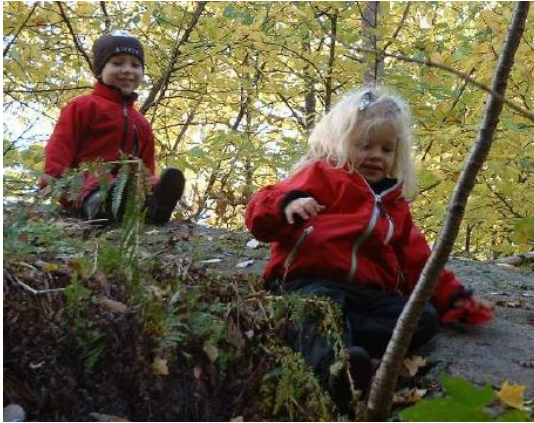
Ilustración 15: Deslizándose por una roca