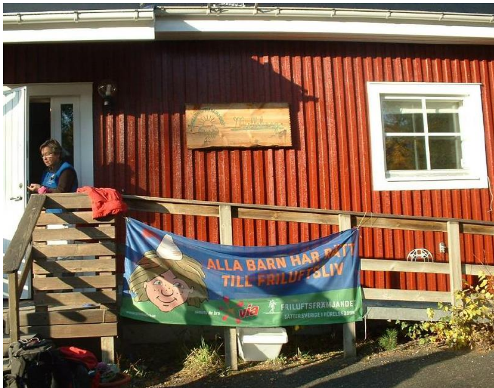
Ilustración 8: Entrada a la escuela I UR OCH SKUR en Mulleborg.

Siw se ha asombrado del interés mostrado en las escuelas I UR OCH SKUR. Su enfoque ha sido establecido en Japón, Alemania, Rusia, Finlandia, Letonia y Noruega. En Japón hay más de 2000 monitores de Skogsmulle y se han llevado a cabo alrededor de 100 cursos para adultos interesados. En 2002 tuvo lugar el primer simposio internacional de Skogsmulle. Este evento de dos días incluía seminarios y grupos de trabajo. Tuvo tanto éxito que los Simposios han tenido lugar cada tres años desde entonces.