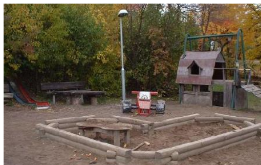
Ilustración 6: Patio de una escuela I UR OCH SKUR

El proceso no fue sencillo. Llevó más de dieciocho meses superar los obstáculos burocráticos y aprender cómo lidiar con los trámites necesarios para poner en marcha una guardería. Los vecinos pusieron el grito en el cielo y numerosas objeciones al establecimiento de una guardería en su comunidad residencial.