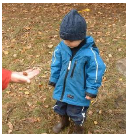
Ilustración 17: Mirando bellotas