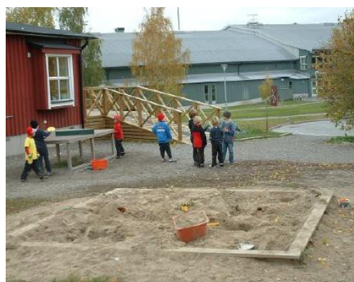
Ilustración 13: Niños jugando después de la escuela