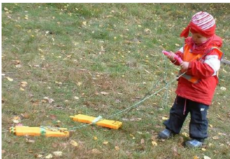
Ilustración 14: Niño con sus "perros"

M. Shimizu y colegas (2002) investigaron la contribución de las actividades “Skogsmulle” en la formación de la conciencia medioambiental y la alfabetización ambiental en Ichijima, una ciudad japonesa. Descubrieron que los niños que habían experimentado alguna actividad Mulle en la ciudad, habían adquirido una mejor conciencia y alfabetización medioambientales y participaban de forma más positiva en las actividades de la comunidad.