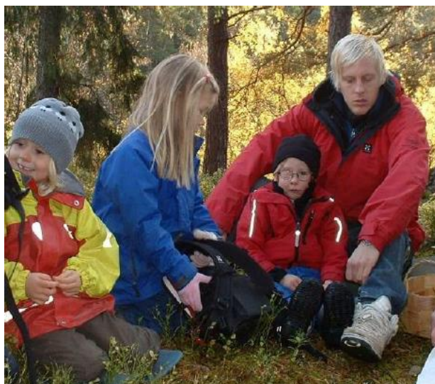
Ilustración 12: Adultos que cuidan realmente marcan la diferencia

de forma coherente invierten más dinero en personal que en materiales. La escuela de primaria I UR OCH SKUR tiene 80 niños y 5 portátiles. Muchos de los recursos se adquieren en IKEA o están hechos por el propio personal, los niños o los padres.