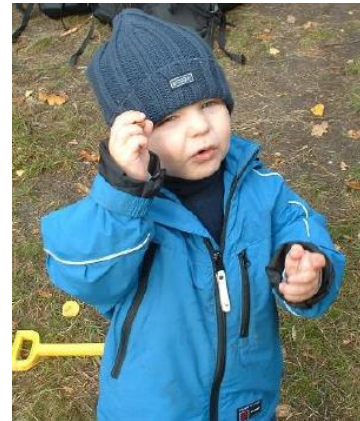
Ilustración 18: Un momento de asombro

El personal citó el siguiente equipamiento como el más útil cuando se trabaja con niños al aire libre: