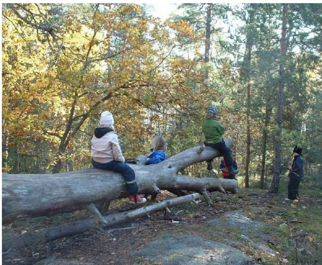
Ilustración 19: Los troncos caídos proporcionan interminables oportunidades de juego