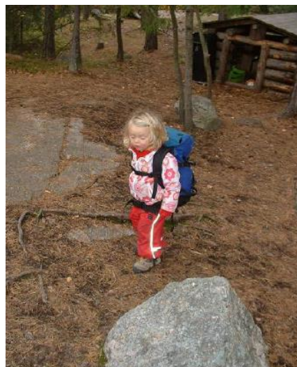
Ilustración 9: Alumna de 2 años en la escuela

Stovarna es para niños de 7 a 10 años. Hacen excursiones, preparan hogueras y mantienen encuentros organizados.