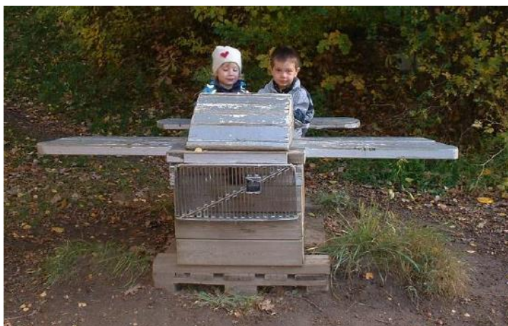
Ilustración 10: Los padres han construido la mayoría de los juguetes y estructuras de los patios de las escuelas

Frilufsarna es para niños de 11 a 13 años. Hacen caminatas más largas, montan en canoa o esquían junto con sus monitores. En ocasiones, esto incluye acampar alguna noche.